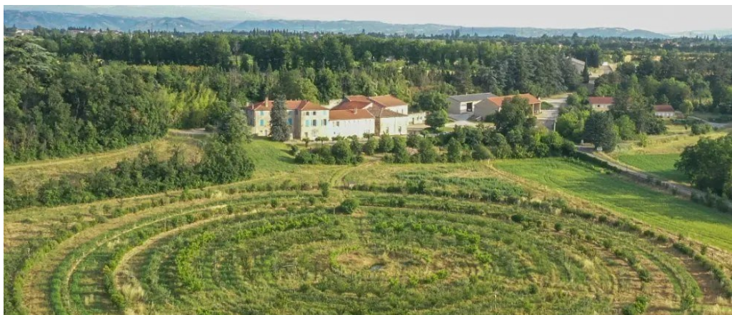
Station INRAE de Gotheron, 2024.(Saint-Marcel-lès-Valence – 26320).

À la station de Gotheron, près de Valence, les chercheurs de l'INRAE travaillent depuis plusieurs années sur le « Projet Z ». L'objectif est de tester une arboriculture sans pesticides tout en limitant fortement les autres intrants. Ce programme de recherche, mené entre 2015 et 2031, repose sur une idée simple mais ambitieuse : utiliser la biodiversité comme principal moyen de protection des cultures.